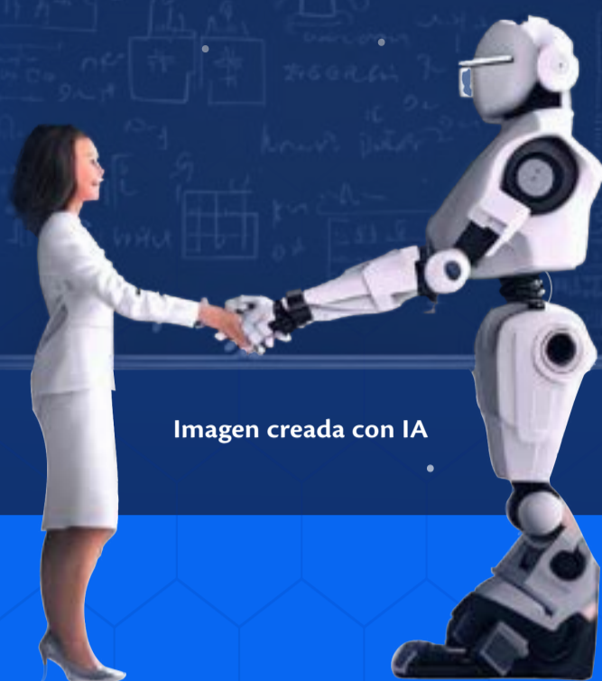
Imagen creada con IA

La IA no es exclusiva para ingenieros o arquitectos, ni va a reemplazarte en tu trabajo. Úsala como un aliado en tus clases. Sigue leyendo y descubre cómo.